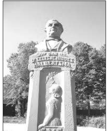
Earebyld dr. Eeltsje Halbertsma, Grou