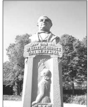
Earebyld dr. Eeltsje Halbertsma, Grou