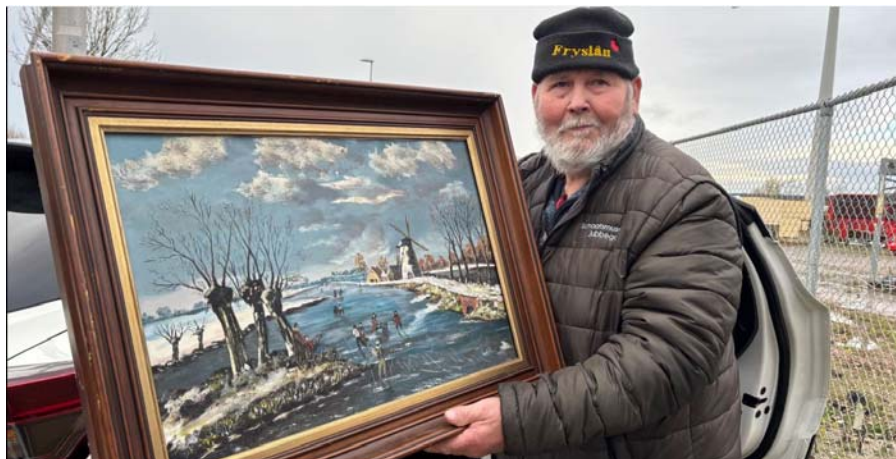
(Kleis Oenema fan it partikuliere reedrydmuseum yn Jobbegea)